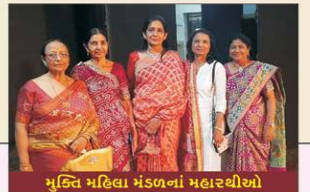
મુક્તિ મહિલા મંડળનાં મહારથીઓ

હજુ પણ આવી ને આવી ઉત્તરોત્તર પ્રગતિ કરતાં રહો એવા અંતરના આશીર્વાદ સાથે સૌ Teachers ને લાખ લાખ અંતરના અભિનંદન.