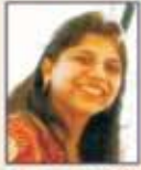
દર્શના નયન ખંડોર