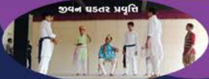
શ્રવણ ઘડતર પ્રવૃત્તિ