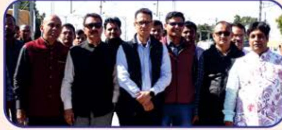
DRM તથા ARM સાથે રેલ્વેના અધિકારીઓ