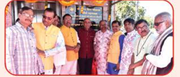
લીફ્ટનું લોકાપર્ણ કરતાં મહાનુભાવો