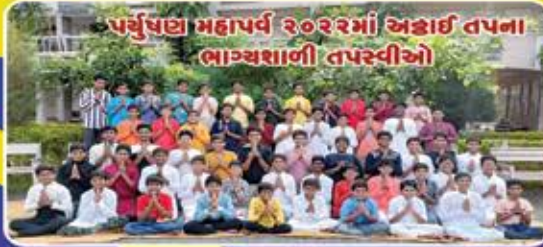
પર્યુષણ મહાપર્વ ૨૦૨૨માં અદ્ભૂત તપના ભાગ્યશાળી તપસ્વીઓ

સંસ્થા દર્શન, રૂબરૂ ઈન્ટરવ્યુ અને એન્ટ્રન્સ ટેસ્ટ માટે તા. ૨૯ જાન્યુઆરી ૨૦૨૩ ના રોજ રવિવારે બાળક સાથે માતા અને પિતાએ રૂબરૂ સોનગઢ પધારવાનું રહેશે.