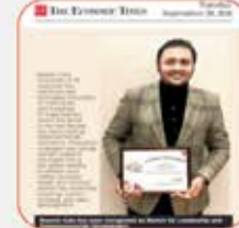
Recognized by TET