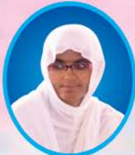
વૈયાવચ્ય પ્રેમી, પ.પૂ.સા. ભવીરત્નાશ્રીજી મ.સા.