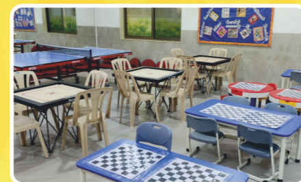
Indoor Games Room