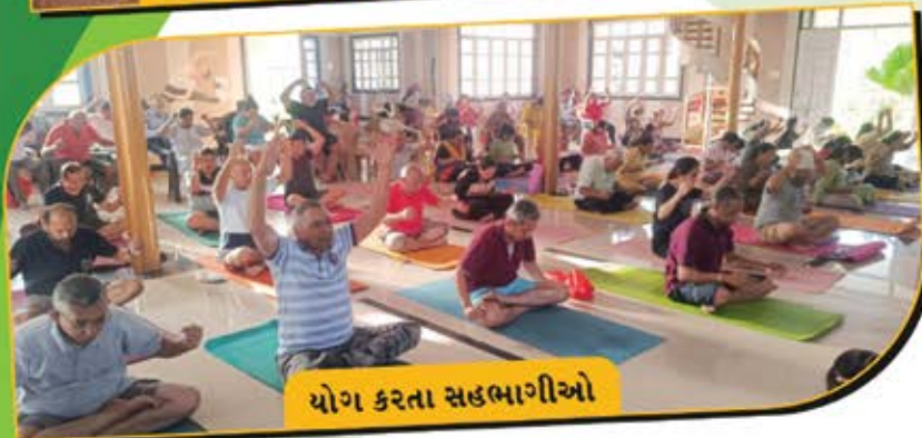
યોગ કરતા સહભાગીઓ