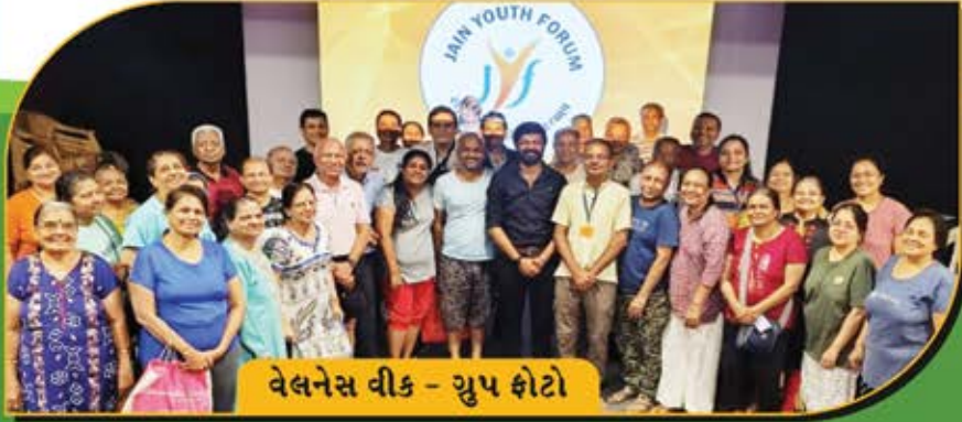
વેલનેસ વીક - ગ્રુપ ફોટો