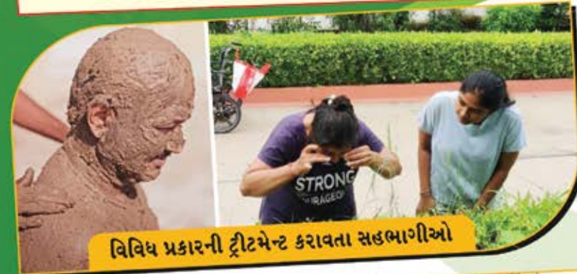
વિવિધ પ્રકારની ટ્રીટમેન્ટ કરાવતા સહભાગીઓ