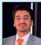
Vatsal Gala Elleys Industries (India) P. Ltd Bada