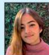
Jeel Gada Elleys Industries (India) P. Ltd Bada