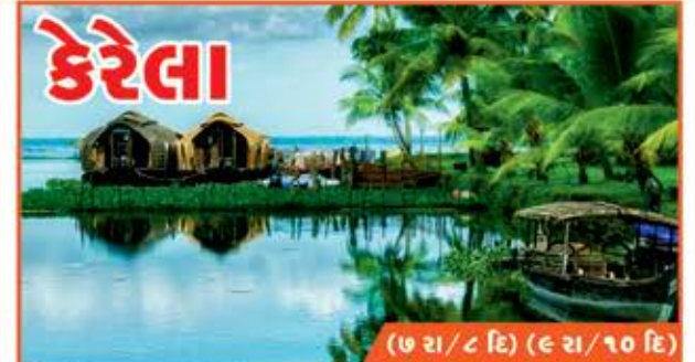
કેરેલા (૭ રાત્રી ૮ દિ) (૯ રાત્રી/૧૦ દિ) કોચીન, મુન્નાર, ઠેકડી, કુમારકોમ, અલેપી, કોવલમ, કન્યાકુમારી May : 21, 25th June : 1st