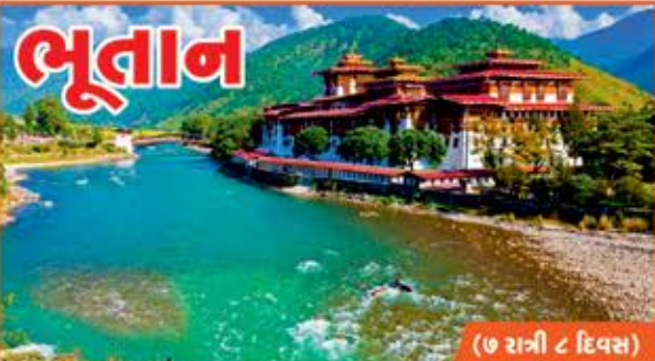
ભૂતાન (૭ રાત્રી ૮ દિવસ) કુત્સોલીંગ, થીમ્પુ, પુનાખા, પારો MARCH : 5, 12, 19, 26 APRIL : 2, 9, 16, 23, 30 MAY : 7, 14, 21, 28

ઉપરોક્ત ઓફર ફક્ત તા. ૫ ફેબ્રુઆરી ૨૦૨૩ સુધી જ