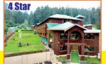
4 Star HILL TOP PAHALGAM 3 NIGHTS

શ્રીનગર, ગુલમર્ગ, સોનમર્ગ, પહેલગામ, દુધપત્રી, સિંચનટોપ