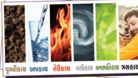
પૃથ્વીકાય અપકાય તેઉકાય વાઉકાય વનસ્પતિકાય ત્રસકાય

સ્થળ: રામદેવ આરાધના ભવન ૧લે માળે, અમી ઝરણા બિલ્ડીંગ, નવનીત હાઈ-ટેક હોસ્પિટલની સામે, દર્હિસર (ઈસ્ટ)