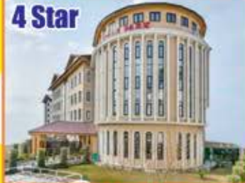
4 Star ASIAN PARK SRINAGAR 3 NIGHTS