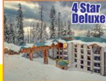
4 Star Deluxe ROYAL CASTLE GULMARG 1 NIGHTS