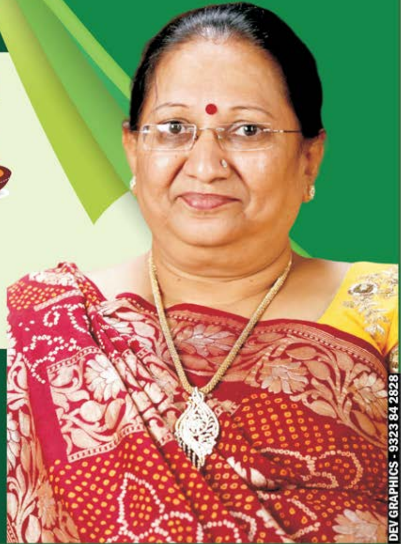
DEV GRAPHICS - 9323 84 2828