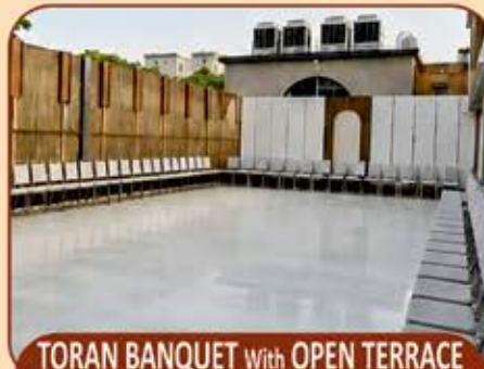
TORAN BANQUET With OPEN TERRACE CAPACITY : 150 TO 250 GUESTS