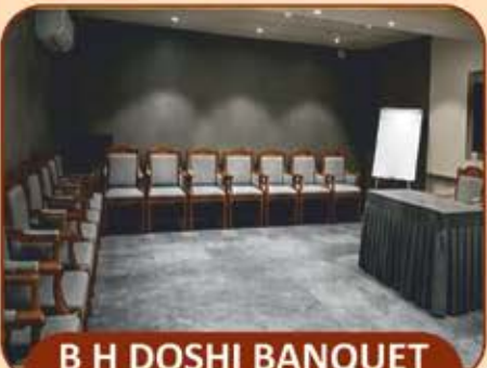
B H DOSHI BANQUET CAPACITY : 30 GUESTS