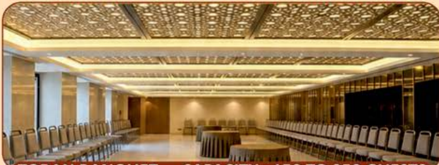
TORAN BANQUET.....CAPACITY : 150 TO 250 GUESTS

PREMIUM BANQUET FACILITIES AVAILABLE FOR ALL TYPES OF FUNCTIONS & EVENTS