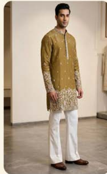
Trendy short Kurta with Korean style pant