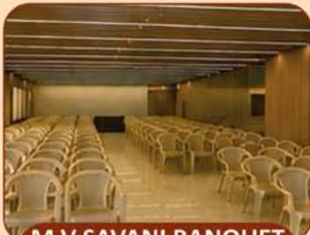
M V SAVANI BANQUET CAPACITY : 100 GUESTS