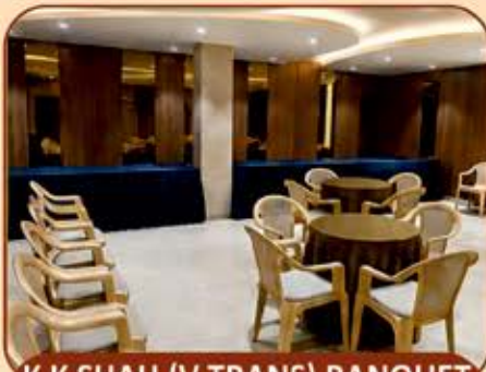
K K SHAH (V TRANS) BANQUET CAPACITY : 50 GUESTS