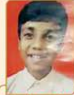
ચશ પ્રમોદ પુનશી માડુ ગામ : વીંચાસર (વય : ૧૧) હાલ રહેઠાણ : ડોંબીવલી (વે)