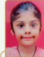
હસ્તી પેરીન રમણીક ગોસર ગામ : ડુમરા (વય : ૯) હાલ રહેઠાણ : ઘાટકોપર