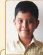
માનવ પરમ પ્રફુલ્લ નાગડા ગામ : નલીયા (વય : ૧૧) હાલ રહેઠાણ : મુલુંડ (વેસ)