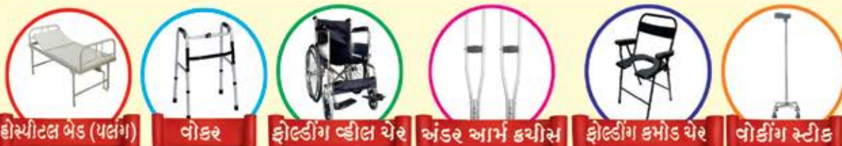
હોસ્પિટલ બેડ (પલંગ) વોકર ફોલ્ડીંગ વ્હીલ ચેર અંડર આર્મ કચીસ ફોલ્ડીંગ કમોડ ચેર વોડીંગ સ્ટીક

શ્રી ઘાટકોપર સંઘમાં માવજતનાં સાધનો ઉપલબ્ધ છે.