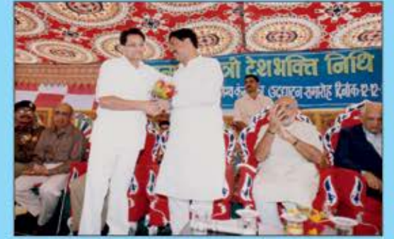
તા. ૧૨-૧૨-૨૦૦૩ના કચ્છ સરહદે ધર્મશાળા ખાતે હોસ્પિટલના લોકાર્પણ વખતે તત્કાલીન સંરક્ષણ મંત્રી પ્રમોદ મહાજન સાથે..