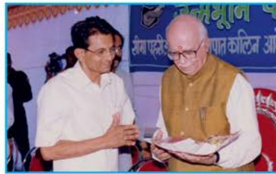
કચ્છ સરહદે હોસ્પિટલ શિલાન્યાસ પ્રસંગે આવેલા તત્કાલીન નાયબ વડાપ્રધાન લાલકૃષ્ણ અડવાણી સાથે...