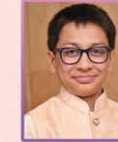
પરમ હર્ષલ ગાલા સમાધોધા