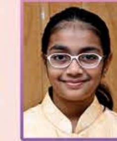
સાયશા નિર્મલ રાંભિયા સમાધોધા