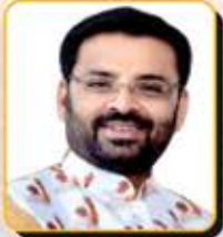
શ્રી વિનોદ ચાવડા MP, Kutch-Morbi