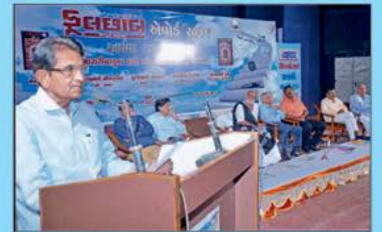
રાજકોટ ખાતે ફૂલછાબ એવોર્ડ વિતરણ સમારંભમાં