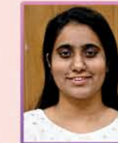
પલક સ્મિથ છેડા લાયજા