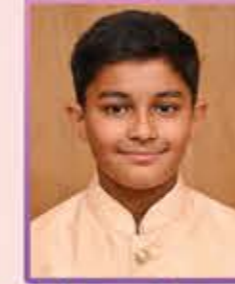
વા.કેપ્ટન કિઆન ડો. કેકીન ગાલા વડાલા