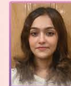
ભૂમિશી હિતેશ ગંગર મોટી ખાખર