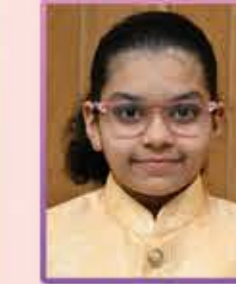
માહી સાગર છેડા વાંકી

ચિલ્ડ્રન યુથ કમિટીના બે કાર્યક્રમ થયા હતા એક મ્યુજિકલ સ્તવન હાઉજી બીજો કાર્યક્રમ મજગામ તેમજ સમાજને લગતા સવાલ જવાબ સાથે સાપ સિડીની રમત બને કાર્યક્રમ લગભગ નાના મોટા મળીને સવાસો થી વધારે સંખ્યામાં મજગામના સભ્યો હાજર રહ્યા હતા.