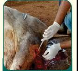
તીક્ષ્ણ હથીચાર વડે ઘાતકી હુમલો કરેલ હતો તેનું સફળ ઓપરેશન કરવામાં આવ્યું.

કાર્યોની વિસ્તૃતિ માટે જોઈતી ૬ એકર જમીનના ઘાતા, તેમજ પ્રવૃત્તિઓથી સંતૃષ્ટ થઈ વર્ષ દરમિયાન નામી અનામી દિલેર ઘાતાઓ તરફથી માતબર રકમ શ્રી સુમતિનાથ પાંગળાઘર/ગાયો ની હોસ્પિટલ ને આવેલ છે તે બદલ સંસ્થા ભુરી ભુરી અનુમોદના કરે છે.