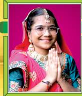
મુમુક્ષુ મૈત્રી ગીતા ચેતન ગડા