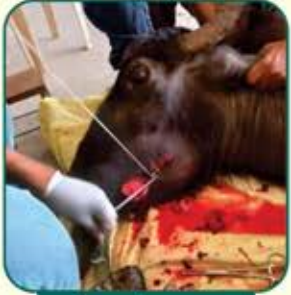
મોટામાં ડલાસ્ટ થયો હતો એનું સફળ ઓપરેશન કરવામાં આવ્યું

જીવદયાપ્રેમી ઘાતાઓ તરફથી અંદાજીત ૬૨,૦૦૦ મણ લીલો, સુકો, ચારો તેમજ અન્ય દાણ-ખાણ અબોલા જીવો માટે દાનમાં આવેલ છે.