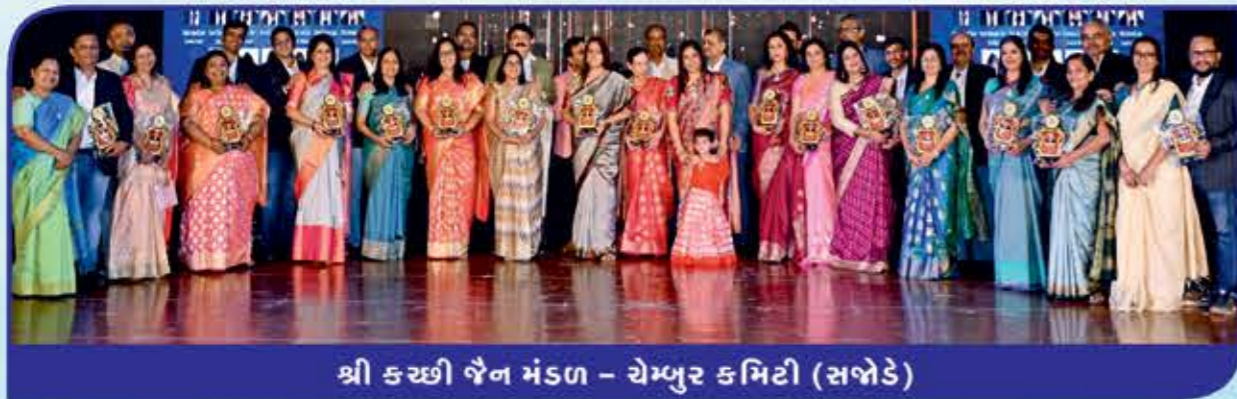
શ્રી કચ્છી જૈન મંડળ - ચેમ્બુર કમિટી (સખેડે)