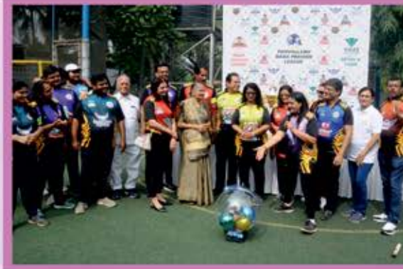
મુખ્ય સ્પોન્સર તથા ટીમ ઓર્ગાઇઝર દ્વારા ટુર્નામેન્ટનો શુભારંભ