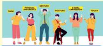
2. Basics of Body Language and Voice Projection