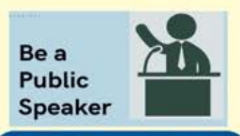
4. Practicing basic Delivery Techniques