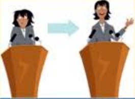
1. Overcoming Fear & Anxiety