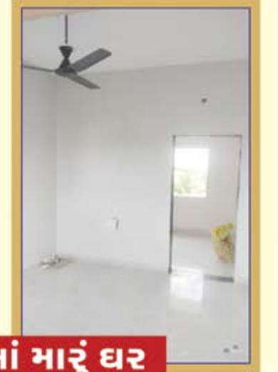
મારા ગામમાં મારું ઘર

“ દેવપુરમાં મારું પોતાનું ઘર મારું આ સ્વપ્નું આજે JYF ની ગ્રેટવાર્ટ JYF આત્મનિર્ભર આવાસ યોજના હેઠળ અને ગાલા ભાવિક મંડળ તથા ગાલા ડેવલપર્સના સહકારથી સાકાર થયું છે.