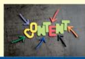
3. Structuring simple speeches of Presentation