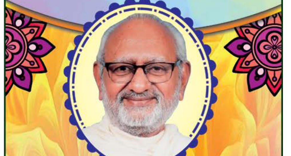
આચાર્યપદ વિભૂષિત માટે શુભનિશ્રા દાતા

આ સુવર્ણ અવસરે આપ સૌ સકળ સંઘ સાથે પધારી શોભામાં અભિવૃદ્ધિ કરશોજી.