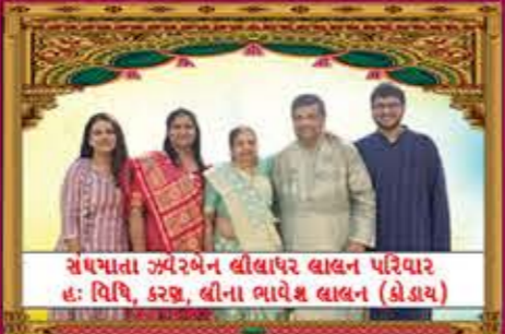
સંઘખાતા અરેબેન લીલાપર લાલન પરિવાર હ: વિધિ, કચ્છ, લીના ભાવેશ લાલન (કોડાય)