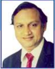
CA વિભલ પુનભિયા