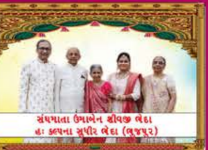
સંઘખાતા ઉમાબેન શૈલજી લેદા હ: કલ્પના સુપીર લેદા (ભુજપુર)