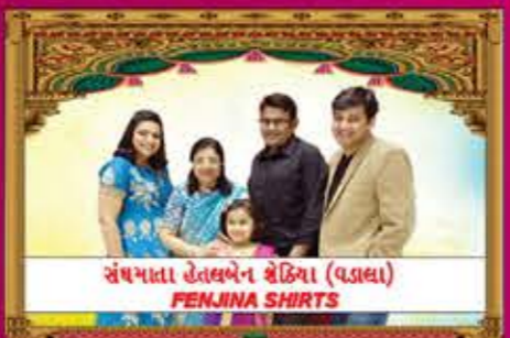
સંઘખાતા હેતલબેન હેઢિયા (વડાલા) FENJINA SHIRTS