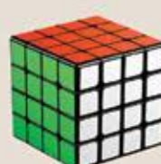
4 Way Cube