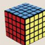
5 Way Cube