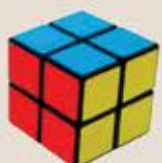
2 Way Cube