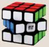
3 Way Cube