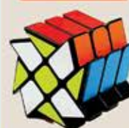
Wind Mill Cube