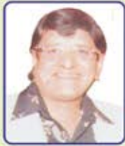
સ્વ. નવીન રવજી છેડા નવીનાળ