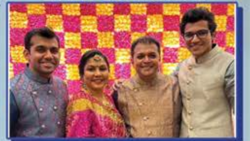
MATUSHREE KESARBEN MULCHAND SANGOI PARIVAAR