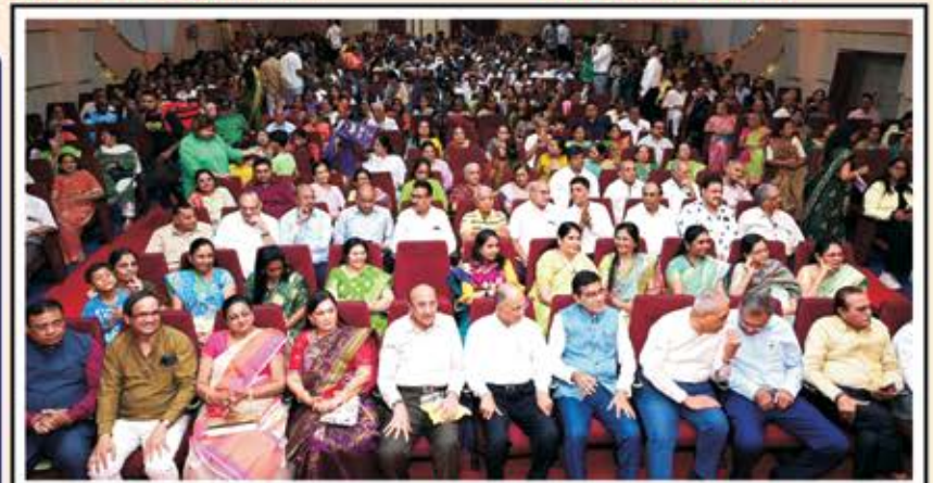
સમગ્ર કાર્યક્રમ માણતા પત્રીવાસીઓની અભુતપૂર્વ હાજરી