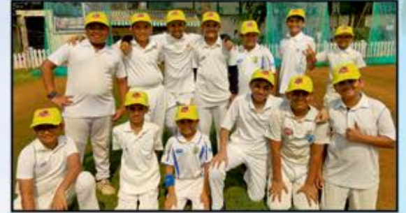
U12 - Team ANTARA SPARKLES