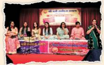
ગીત સંગીતની રસલ્હાણ કરતી પત્રીની દીકરીઓ