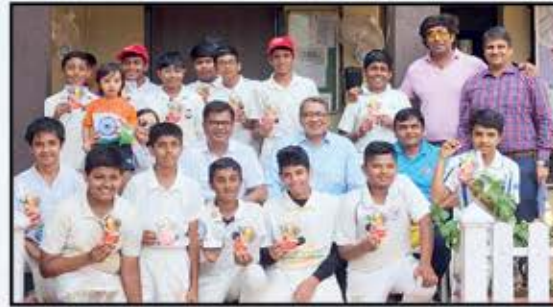
Runners Up U14 - Team Wilkin Mota