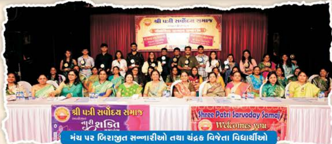
મંચ પર બિરાજીત સન્નારીઓ તથા ચંદ્રક વિજેતા વિદ્યાર્થીઓ