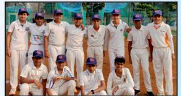
U14 - Team Keval Kakka