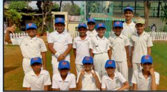
U12 - Team ANTARA RISERS