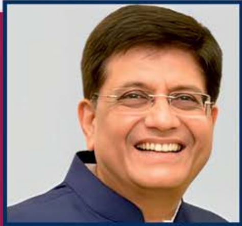
માનનીયશ્રી પિયુષ ગોયેલજી કેન્દ્રીય મંત્રી