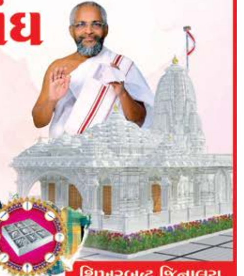
શિખરબદ્ધ જિનાલય નવનિર્માણ

નવી મુંબઈની ઘન્ય ધરા પર વસનારા એવા અમારા આંગણે ૩૬૦ અવસર આવ્યો છે. બીજાંથી અંકુર છોડ અને એ પછી જાજરમાન વડલા સ્વરૂપે અમારા શ્રી સંઘને શીતળ છત્રછાયા દાતા શ્રી મુનિસુપ્રત દાદા અનરાધાર વરસી રહ્યા છે. વીર સવંત ૨૦૫૦ માં પ.પૂ.આ.ભ. શ્રી કલાપ્રભસાગરસૂરીશ્વરજી મ.સા. ની પાવન પ્રેરણાથી શ્રી નવી મુંબઈ અચલગચ્છ જૈન સંઘ - વાશીની સ્થાપના થઈ. શરૂઆતના વર્ષોમાં ઘર દેરાસરથી લઈ આજની ઘડી એ શિખરબદ્ધ જિનાલય સુધીનો લગભગ ત્રીસ વર્ષનો પ્રવાસ દરેક સંઘવાસીની ધર્મ ભાવના, સંઘના વિકાસ અર્થે ઉદારતા તેમજ મૈત્રીપૂર્ણ સહકારના તાદૃશ્ય દર્શન કરાવનાર રહ્યો. જેને પરિણામરૂપે સંઘ આજની ગૌરવ લેનારી પળોને માણી રહ્યો હોય ત્યારે શરૂથી અત્યાર સુધી આ ધર્મકાર્યમાં ઓતપ્રોત થયેલ દરેક નાની મોટી વ્યક્તિનો વિશેષ આભાર માનવો ઘટે. શિખરબદ્ધ જિનાલયના નિર્માણના પડઘમ વાગી રહ્યા છે એ સમયે શરૂઆતથી અમોને સહકાર્ય કરી પ્રોત્સાહન દેનાર દરેક વ્યક્તિ અથવા પરિવાર, શ્રી સંઘની નિયાણી બહેનો સહકુટુંબ ઉપરાંત આપ સર્વ સાધર્મિક પરિવારોને સહકુટુંબ શીલાન્યાસ પ્રસંગે પધારવા આમંત્રણ પાઠવીએ છીએ. અમારા શ્રી સંઘમાં આનંદ સમાતો નથી. ઘરઘરમાં, ઘટઘટમાં ઉદ્ધાસના દિવડા પ્રગટયા છે. પ્રભુના આ પ્રસંગને રજવાડી બાદશાહી ઠાઠથી ઉજવવા અમારો સંઘ કટીબદ્ધ બન્યો છે.