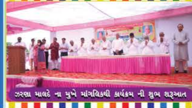
ઝરણા માલદે ના મુખે માંગલિકથી કાર્યક્રમ ની શુભ શરૂઆત