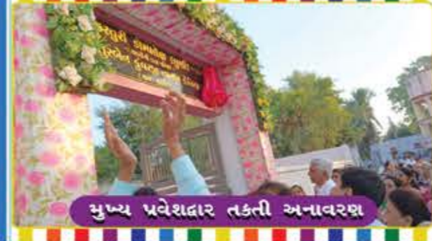
મુખ્ય પ્રવેશદ્વાર તકની અનાવરણ