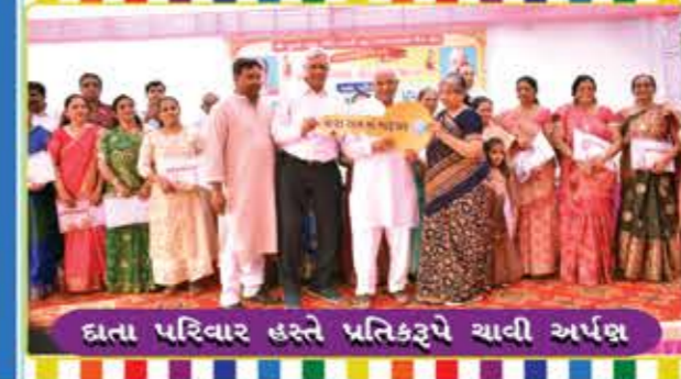
દાતા પરિવાર હસ્તે પ્રતિકરૂપે ચાવી અર્પણ