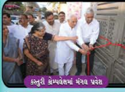
કસ્તુરી કોમ્પ્લેક્ષમાં મંગલ પ્રવેશ

આપ જેવા સ્નેહી કયાં, આપ જેવા સ્વજન કયાં યાદ કરે લુણી સંઘ, આપની સમર્પણ ભાવના.