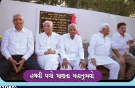
હળવી પળે માણતા મહાનુભવો