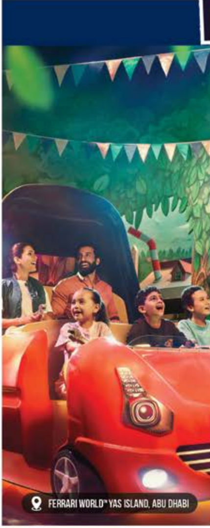
FERRARI WORLD™ YAS ISLAND, ABU DHABI