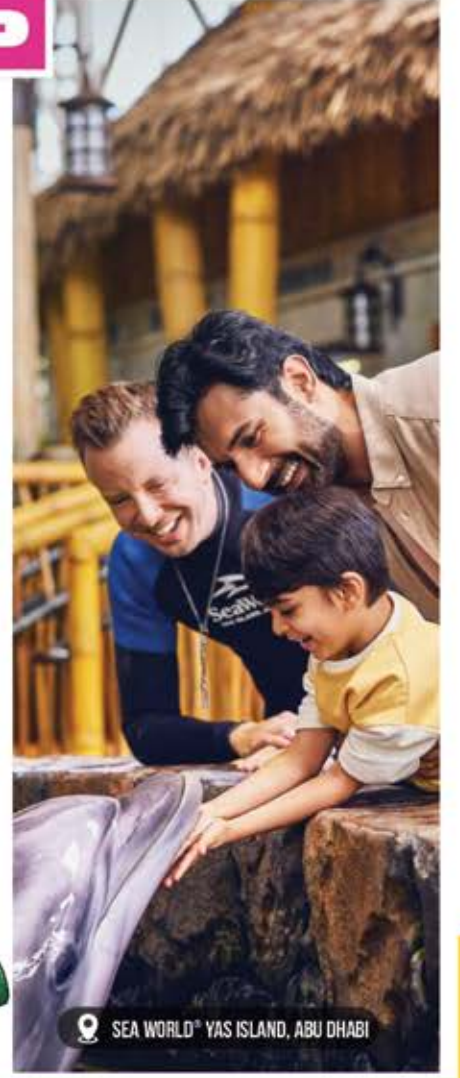
SEA WORLD™ YAS ISLAND, ABU DHABI

૨,૧૦,૦૦૦ થી પણ વધારે ફેમિલીનું સફળતાપૂર્વક વેકેશન આયોજિત કરનાર ગુજરાત ની એક માત્ર કંપની