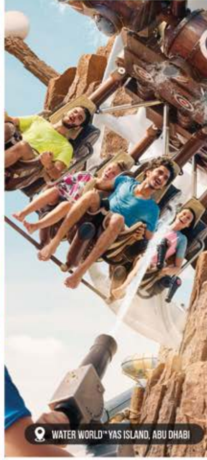
WATER WORLD™ YAS ISLAND, ABU DHABI