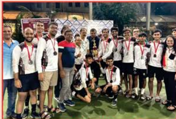
Shree Mulund kvo FC