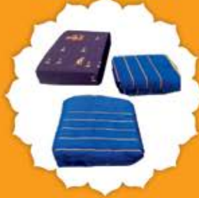
Bed & Bath Linen