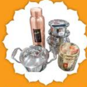
St. Steel / Copper / Brass Utensils