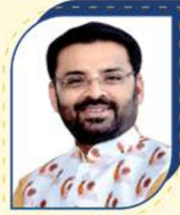
શ્રી વિનોદ ચાવડા MP, Kutch-Morbi