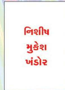
નિશીથ મુકેશ ખંડોર