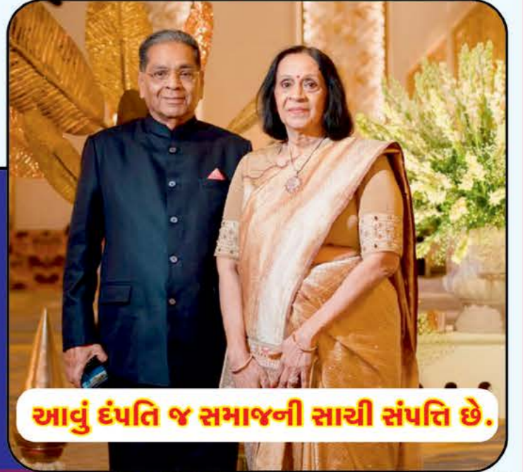
આવું દંપતિ જ સમાજની સાચી સંપત્તિ છે.