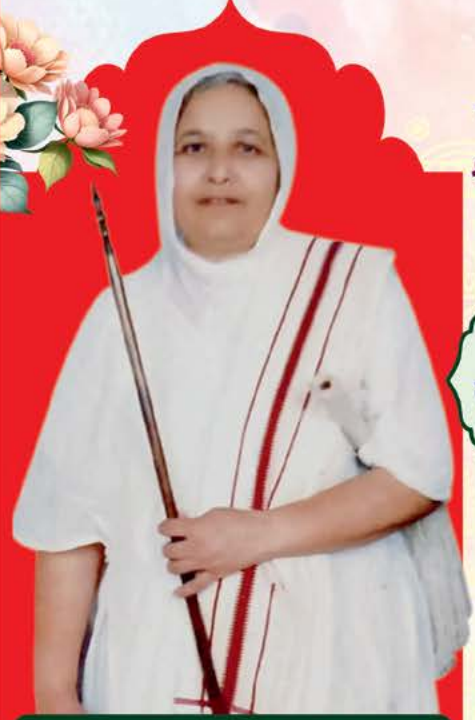
પ.પૂ.સા. શ્રી વિશ્વદર્શિતાશ્રીજી મ.સા.

મહોત્સવ સ્થળ : રામકુંજ બિલ્ડીંગ, દીન દયાલ નગર, વસઈ (વે) લી. ટ્રસ્ટીગણ