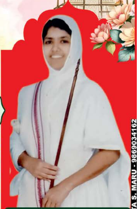
પ.પૂ.સા. શ્રી જિનદર્શિતાશ્રીજી મ.સા.