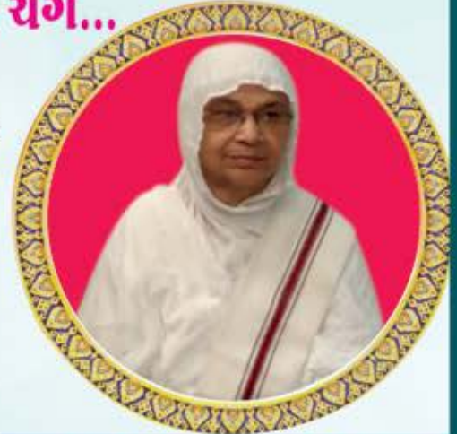
પ.પૂ. સા.શ્રી વિપુલગુણાશ્રીજી મ.સા.