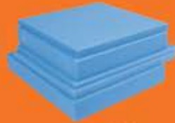
Solid Water He