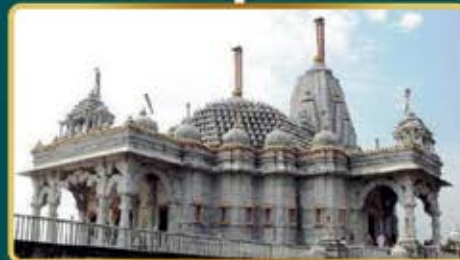
Jain Derasar In Premises