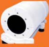
ArcCheck with MapCheck