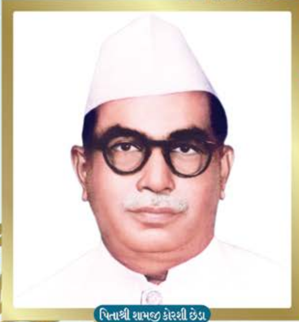
પિનાશ્રી શામજી કોરશી છેડા

સાધર્મિક પરિવારોના મેડિકલેમ સહાય દાતાશ્રી