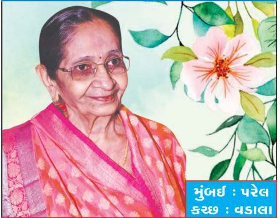
મુંબઈ : પરેલ કચ્છ : વડાલા

આ જન્મ મીટેના તારા જાણ ઓ માવડી રનેહ, સંસ્કાર સીંચતી મીઠી વીરડી હજી લઈ રહ્યા, તારી મમતા તણી છાંચડી આવી ગઈ અસહ્ય તારી વિદાયની ઘડી