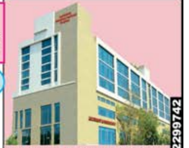
Kokilaben Dhirubhai Ambani Hospital - Navi Mumbai

Address : Kokilaben Dhirubhai Ambani Hospital, Thane Belapur Road, Opp. KoparKhairane Railway Station, Navi Mumbai