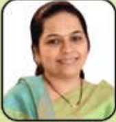
છાચા અજય છાડવા (મોટી ખાખર)