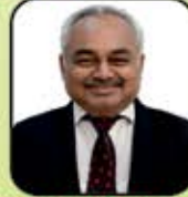
વસંત ચાંપશી ગડા (ગુંદાલા)