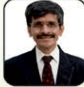
ઉત્કલ રતનજી ગડા (બાડા)