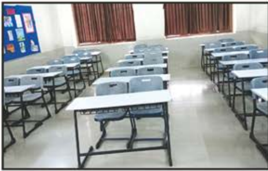
તપોવન વિદ્યાલય (ભિવંડી)