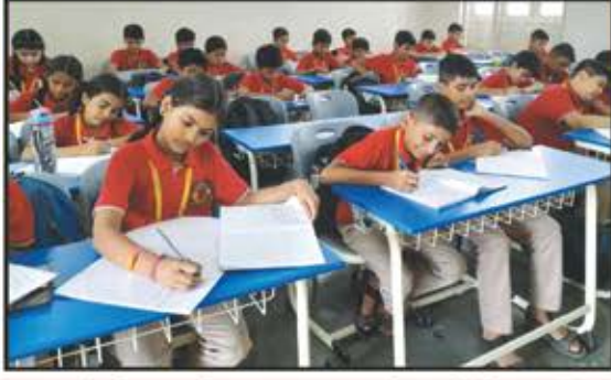
શ્રી હાલારી વિશા ઓસવાલ સ્કુલ એન્ડ કોલેજ (ભિવંડી)

આપે દાખવ્યો 'ડેકોરેટીવ' માં વિશ્વાસ, સદા આપતો રહેશે ઉત્તમતાનો અહેસાસ !