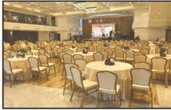
ગુજરાતી સમાજ બેંકવેટ હોલ-પૂના