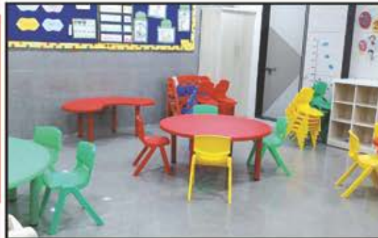
સી.યુ. શાહ સાર્વજનિક હાઈસ્કુલ (કાંદિવલી ઈસ્ટ)

Factory : _____ L-11/12, Shree Rajlakmi Park Ltd., Opp. Delhi Darbar Hotel, Village Pogaon, BHIVANDI-421302. Tel.: + 91 91121 10165 • info@decorative.co.in