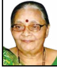
હમલા મંજલના ભાવ્યવંતી હરિયા