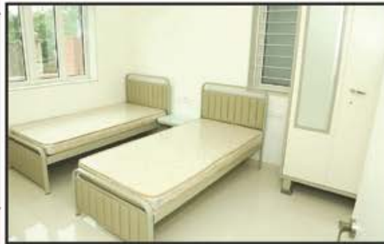
શ્રી આઠ કોટી નાની પક્ષ સ્થાનક (ગુંદાલા)

ક.વિ.ઓ. સમાજની વિવિધ સંસ્થાઓ તરફથી અમારા કામમાં વિશ્વાસ રાખી સંસ્થા સાથે કામ કરવાની તક આપવા બદલ 'ટીમ ડેકોરેટીવ' હૃદયપૂર્વક આભાર માને છે. ભવિષ્યમાં પણ સમાજ પ્રત્યેનું ઋણ સમજી વધારે ઉત્કૃષ્ટ કામ આપવાનો પ્રયત્ન કરશું. અગાઉ અમારી સાથે જોડાયેલ સંસ્થાઓનો પણ આ અવસરે ખાસ આભાર માનીએ છીએ.