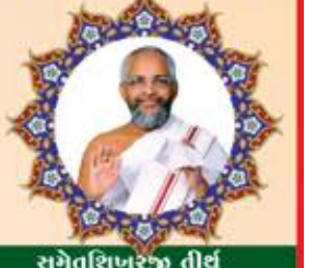
સમેતશિખરજી તીર્થ અચલગચ્છક્ષેત્ર જીર્ણોદાર પેરડ અચલગચ્છાધિપતિ પૂ.પૂ.આ.ભ. શ્રી કલાપાભસાગરસૂરીયરજી મ.સા.