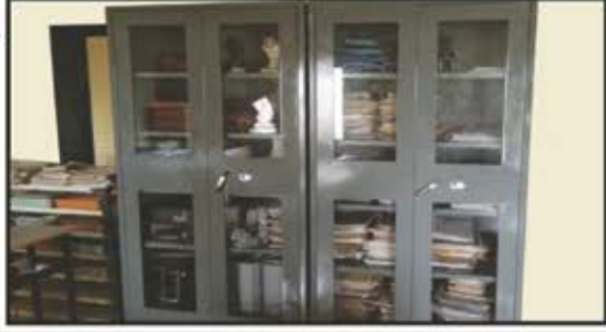
તરૂણ મિત્ર મંડળ (લાલબાગ)