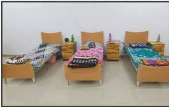
જીતો એડ્યુકેશનલ એન્ડ મેડીકલ ટ્રસ્ટ (ઠાણે વેસ્ટ)