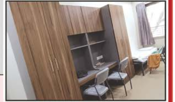
હીરજી ભોજરાજ એન્ડ સન્સ ક.વિ.ઓ. જૈન છાત્રાલય (માટુંગા બોર્ડિંગ)

ક.વિ.ઓ. સમાજની વિવિધ સંસ્થાઓ તરફથી અમારા કામમાં વિશ્વાસ રાખી સંસ્થા સાથે કામ કરવાની તક આપવા બદલ 'ટીમ ડેકોરેટીવ' હૃદયપૂર્વક આભાર માને છે. ભવિષ્યમાં પણ સમાજ પ્રત્યેનું ઋણ સમજી વધારે ઉત્કૃષ્ટ કામ આપવાનો પ્રયત્ન કરશું. અગાઉ અમારી સાથે જોડાયેલ સંસ્થાઓનો પણ આ અવસરે ખાસ આભાર માનીએ છીએ.