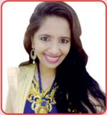
ગીત સંગીત ચાર્મી સતરા (ભેદા) - વડાલા