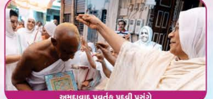
અમદાવાદ પ્રવર્તક પદવી પ્રસંગે