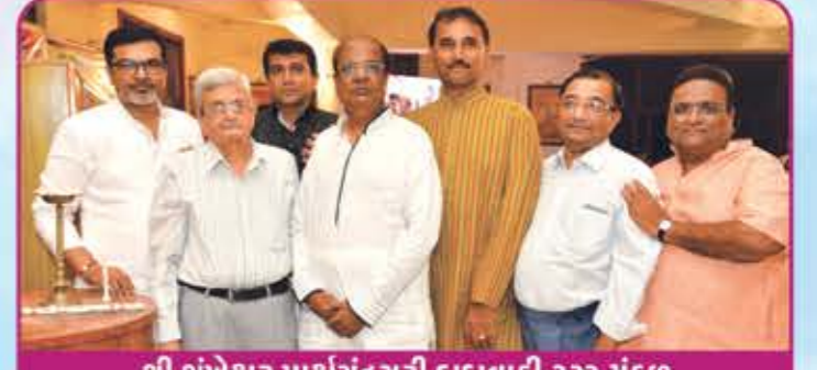
શ્રી શંખેશ્વર પાર્શ્વચંદ્રસૂરી દાદાવાડી ટ્રસ્ટ મંડળ