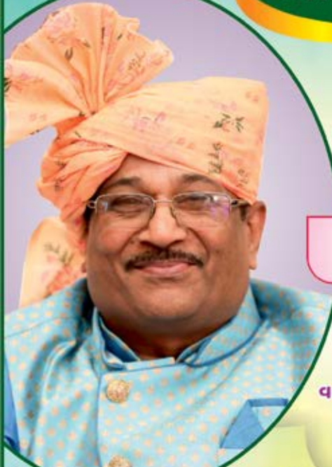
અરિહંતશરણ : તા.૨૭/૨/૨૦૨૪