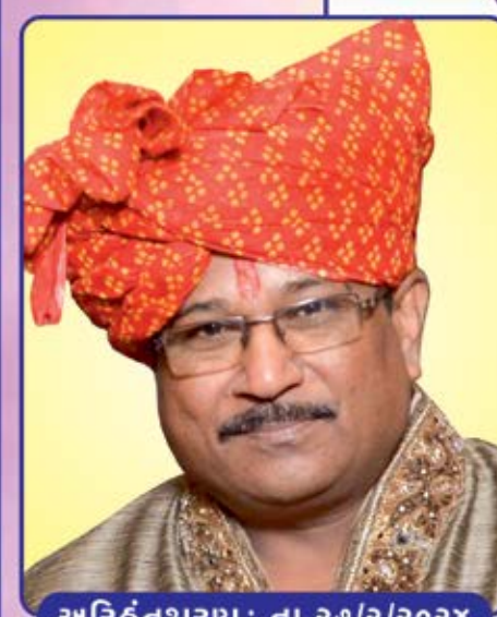
અરિહંતશરણ : તા.૨૭/૨/૨૦૨૪