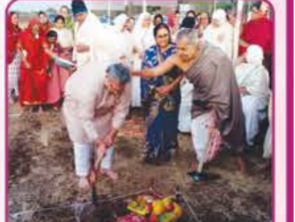
પારસ વાટિકા (કચ્છ) ખાતે મુલ્ટ પ્રેરિકા પ.પૂ.સા. સુનંદા સુરભિ સુનંદિતાશ્રીજી મ.સા.