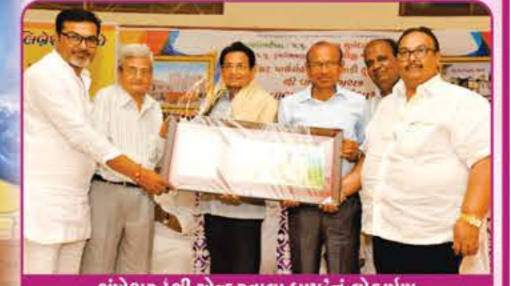
શંખેશ્વર 'શ્રી એન્કરવાલા ધામ'નું લોકાર્પણ