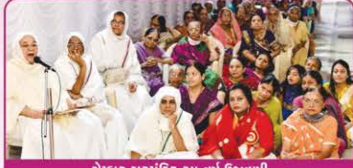
ચેમ્બુર ગુરુમંદિર ૨૫ વર્ષ ઉજવણી