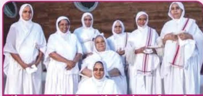
શંખેશ્વર જહાજ મંદિર પ્રતિષ્ઠા પ્રસંગે શ્રી પાર્શ્વચંદ્રગચ્છીય સાધ્વીગણ