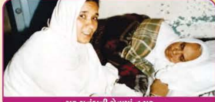
ગુરુ સુનંદાની સેવામાં તત્પર