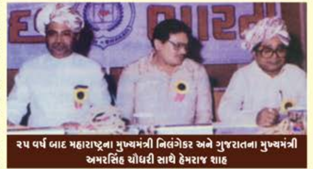
૨૫ વર્ષ બાદ મહારાષ્ટ્રના મુખ્યમંત્રી નિલંગેકર અને ગુજરાતના મુખ્યમંત્રી અમરસિંહ ચૌધરી સાથે હેમરાજ શાહ

બૃહદ મુંબઈ ગુજરાતી સમાજની સ્થાપના ૧૯૮૫ માં ૩૧મી ડિસેમ્બરે કરી, ત્યારે પણ બન્ને મુખ્યમંત્રીઓ ૧૧.૧૧.૨૧ નિલંગેકર પાટીલ અને અમરસિંહ ચૌધરી અને કેન્દ્ર સરકારમાંથી યોગેન્દ્ર મકવાણાએ હાજરી આપી હતી.