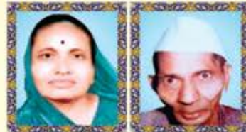
સંઘમાતા ધનબાઈ ખીમજી કાનજી દેઢિયા હ: ઉમિત વિજયા પ્રવિણ દેઢિયા પર્વ ચેશા ચતીન દેઢિયા