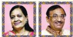
સંઘમાતા હર્ષાબેન CA લક્ષ્મીચંદ ખેરાજ દેઢિયા હ: કિચાંશ હીતા દર્શન દેઢિયા