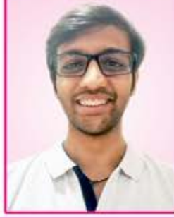
આદેશ અનુલ શાહ ટાણા, ગુજરાત