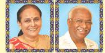
સંઘમાતા ભારતીબેન પ્રફુલચંદ્ર મોરારજી દેઢિયા હ: રૂઢી, પ્રીશ અવની વિશાલ પ્રફુલચંદ્ર દેઢિયા