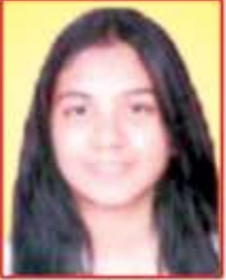
કેરવી દિનેશ કારીયા સુવર્ધ, કચ્છ