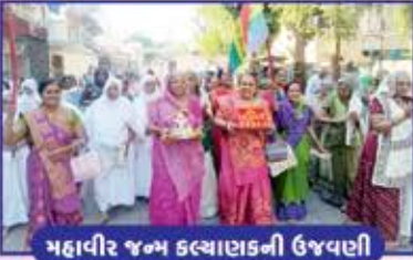
મહાવીર જન્મ કલ્યાણકની ઉજવણી