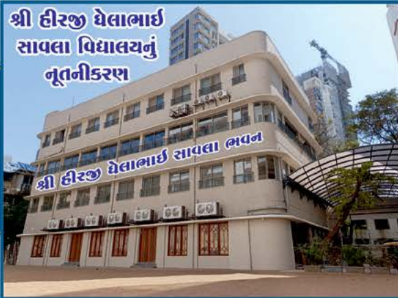
શ્રી હીરજી ઘેલાભાઈ સાવલા વિદ્યાલયનું નૂતનીકરણ