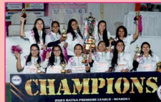
Women's Winner Team FRISCH FIGHTERS