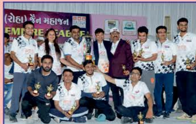
Men's Runnerup Team ANAND KE BAZZIGAR