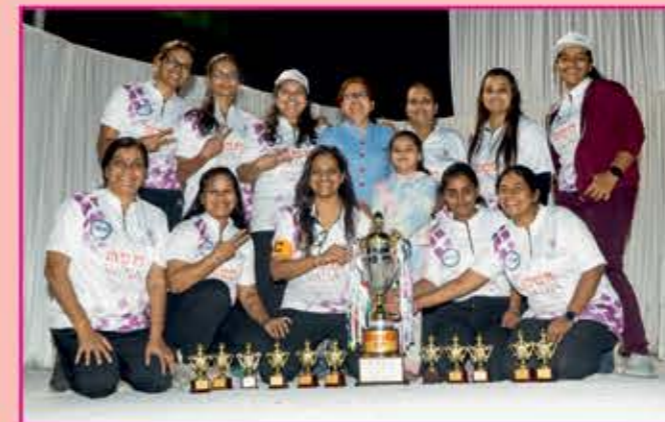
Women's Runnerup Team PRATHAM STRIKERS

જેઓની મહેનતે આ કાર્યક્રમને ભવ્યતા બક્ષી એવું અમારું કોટડા યુવા ધન