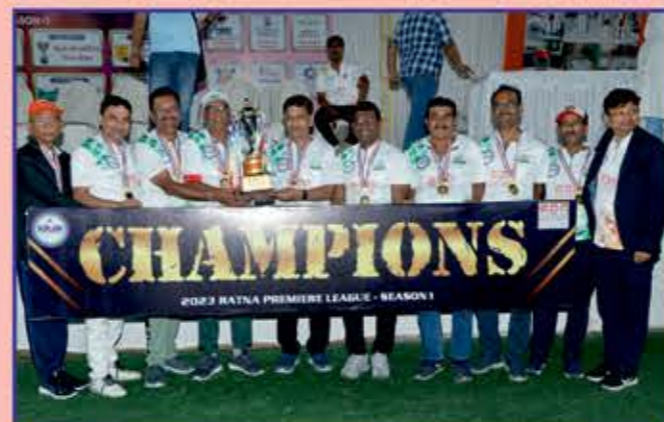
Senior Men's Winner Team GALA BROTHERS