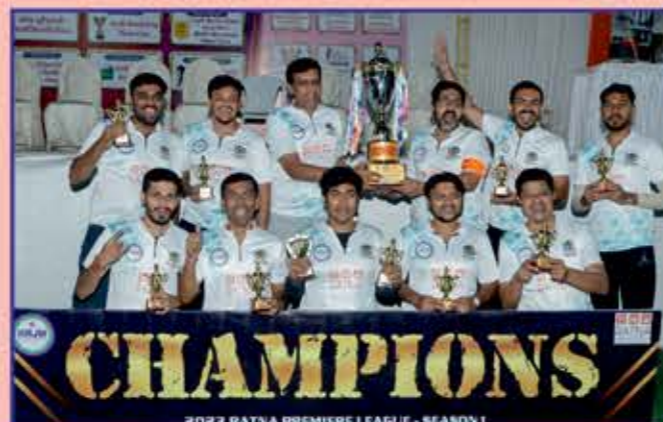
Men's Winner Team VIKMANI KE VEER