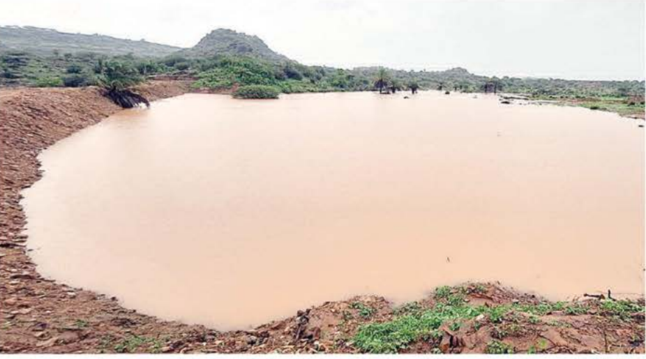
જળસંગ્રહનાં કામો થકી આવા આંખ ઠારતા દૃશ્ય કચ્છમાં ઠેર ઠેર જોવા મળે છે.