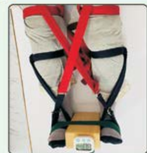
Osteoarthritis of Knee

બધી જાતના Orthopaedic અને Musculoskeletal પ્રોબ્લેમ્સથી રાહત પામો