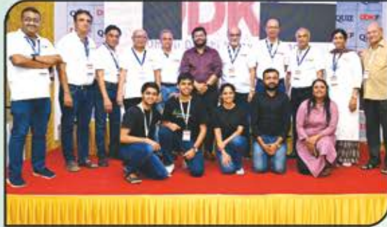
Committee Members with Our Volunteers