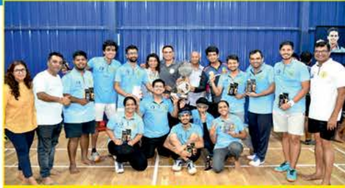
Winner Team - Supreme Strikers