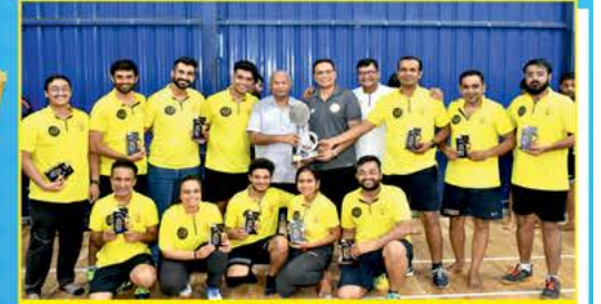
Runner Up Team - Royal Kings