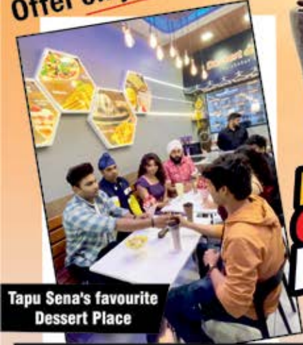
Tapu Sena's favourite Dessert Place