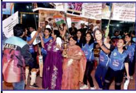
Best Theme Parade Neelpari's Supreme