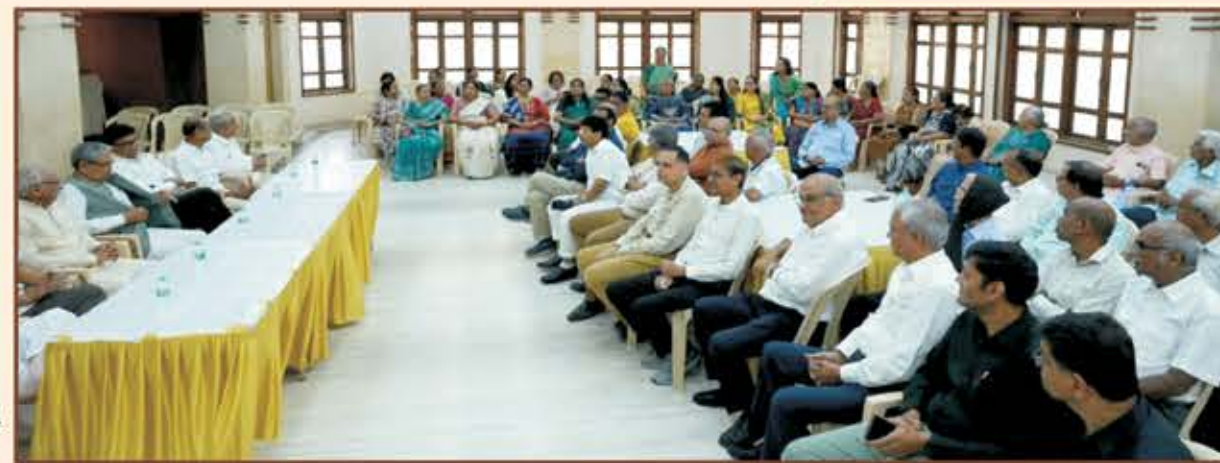
લિ. ડ્રસ્ટીઓ, અધિકારીઓ તથા કારોબારી સભ્યો

દાદર સંઘના મહાનુભાવો અને કચ્છી સમાજના શ્રેષ્ઠીઓની ઉપસ્થિતિ વચ્ચે “વર્ધમાન મેડીકો” (રાહત દરે દવાઓના વેચાણ કેન્દ્ર) નો ઉદ્ઘાટન સમારંભ સંપન્ન થયેલ હતો.