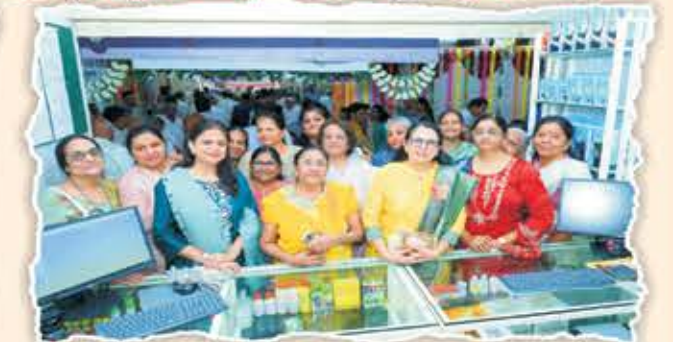
વર્ધમાન મેડીકો ના શુભારંભ બાદ મહેમાનો સહ મહિલા ગ્રાહકોની પ્રચંડ ઉત્સાહભેર ગિરદીની ઝલક