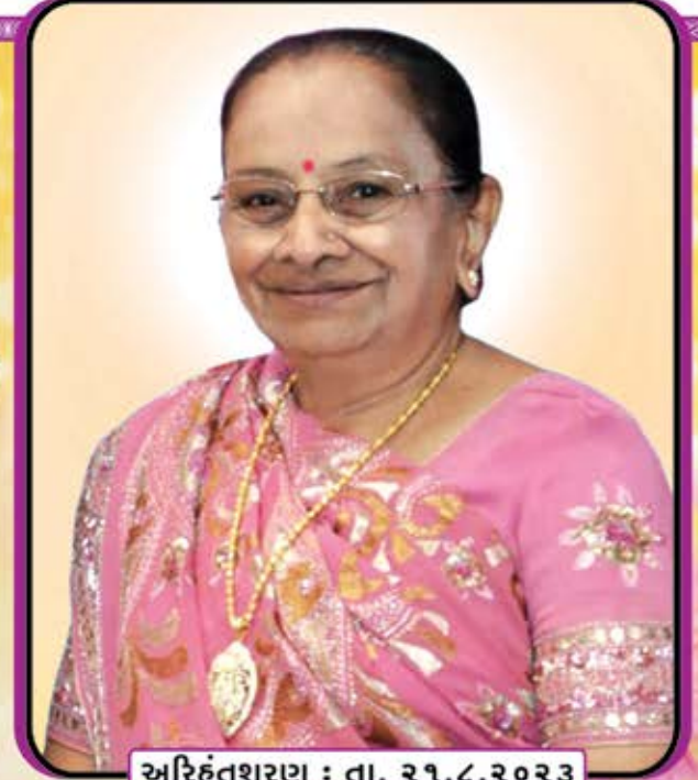
અરિહંતશરણ : તા. ૨૧.૮.૨૦૨૩