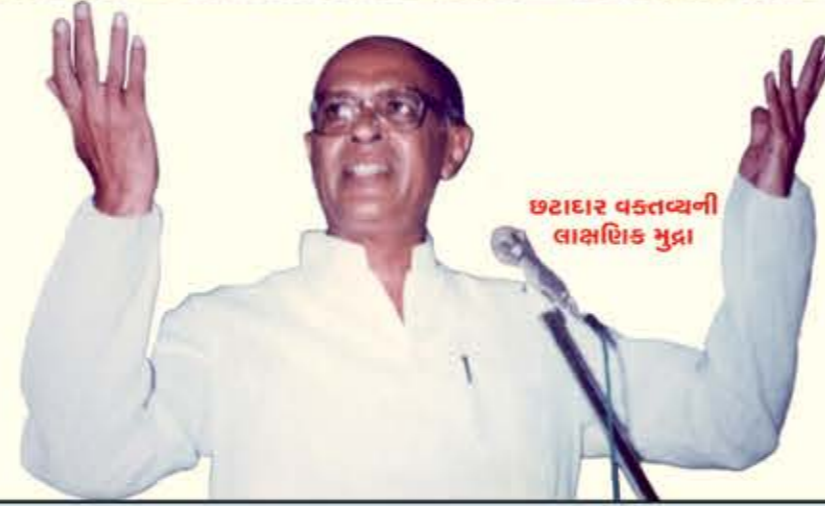
છટાદાર વકતવ્યની લાક્ષણિક મુદ્રા