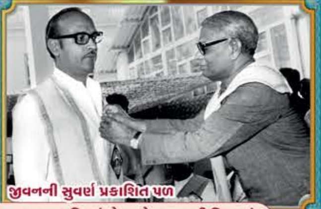
જીવનની સુવર્ણ પ્રકાશિત પળ