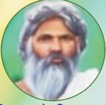
અધિનાયક યોગનિષ્ઠ પ.પૂ. આ. શ્રી બુદ્ધિસાગરસૂરીશ્વરજી મ. સા.