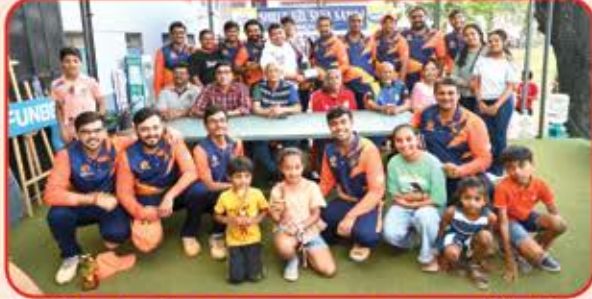
PLATE GROUP FINAL - WINNER TEAM - WADALA

ELITE GROUP FINAL - WINNER TEAM - BIDADA