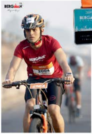
Cycling : 40 kms