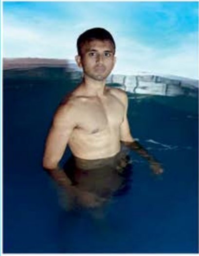
Swimming : 1.50 kms