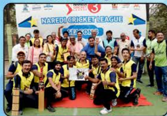
Master Blaster Channel Master