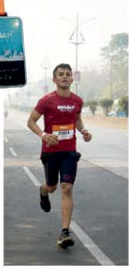
Running : 10 kms

Total : 51.50 kms in just 3 hours 24 minutes 12 secs.