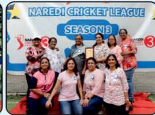
Thanks to Veergun Mahila Mandal & Volunteers