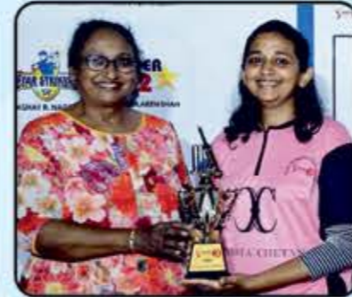
Woman of the Series Forum R Nagda