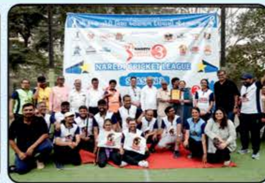
Gala Gladiators Gala Brush